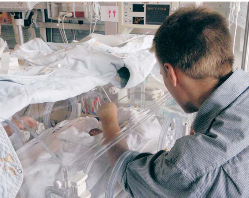
Far pusler om Rebecca.